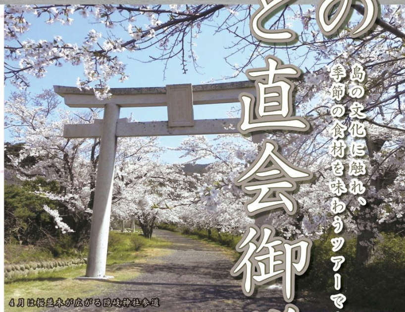
4月は桜並木が広がる隠岐神社参道