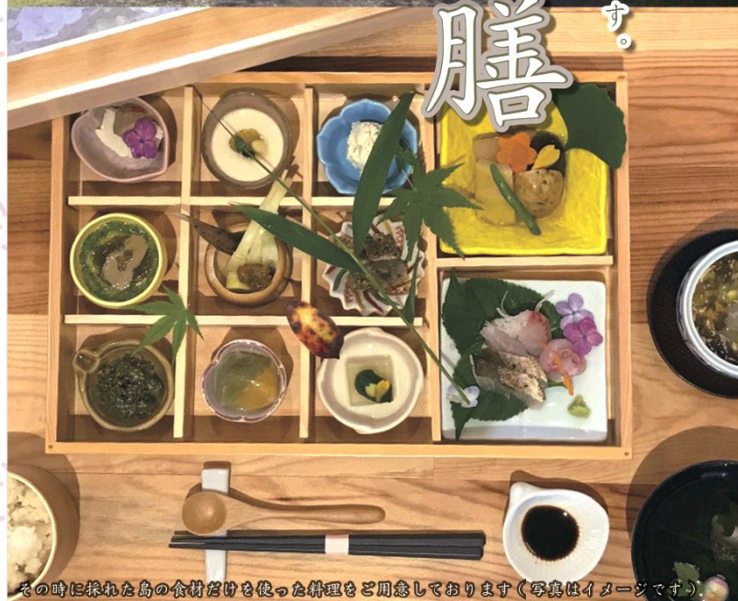
その時に採れた島の食材だけを使った料理をご用意しております（写真はイメージです）